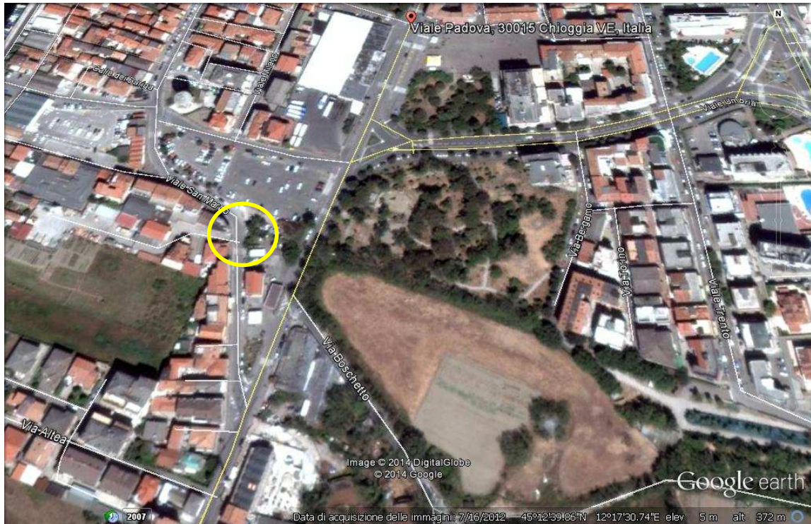
Immagine da satellite